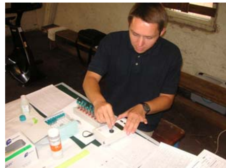
Auslesen der Lactatwerte