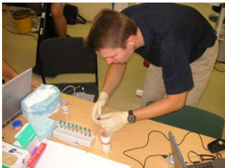
Testplatz auf Feuerwache