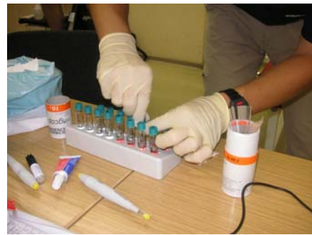
Proben in Küvetten