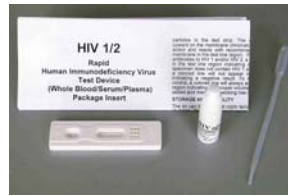
HIV Typ 1 und 2